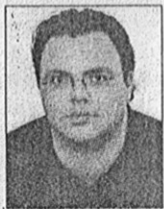
ΤΟΥ ΑΝΔΡΕΑ ΠΑΡΑΣΧΟΥ

Αν κάποιος που δεν έχει σχέση με την κυπριακή πραγματικότητα άκουγε τις κατηγορίες που εξακοντίζονται -το τελευταίο κυρίως διάστημα-εναντίον του Τάσσου Παπαδόπουλου, η πρώτη απορία που σίγουρα θα διетύπωνε είναι «πώς μια τόσο αμφιλεγόμενη προσωπικότητα μπορεί να διεκδικεί το χρίσμα του Προέδρου της Δημοκρατίας;» Επειδή όμως εμείς έχουμε σχέση με την κυπριακή πραγματικότητα, δεν μπορούμε να θέσουμε αφελή ερωτήματα, ιδιαίτερα σε ένα άνθρωπο που είναι πιθανόν να μας κυβερνήσει. Γι' αυτό ρωτήσαμε τον Τάσσο Παπαδόπουλο να μας πει μεταξύ άλλων αν είναι απορριπτικός και αλλεργικός με την επαναπροσέγγιση. Γιατί δεν τον συμπαθούν οι Αμερικανοί ή γιατί ο ίδιος δεν συμπαθεί τον Γιώργο Βασιλείου. Αν υπάρχουν στο ΔΗΚΟ οι Τασσικοί και οι άλλοι. Αν συμβαδίζει το «νομικός σύμβουλος του ΧΑΚ με το δικηγόρος δημόσιων εταιρειών». Αν μετείχε στο μεγάλο φαγοπότη με τα δολάρια του Μιλόσεβιτς κι αν είναι καθαρός, γιατί οργίζεται. Και τέλος αν ως πολιτικός του '60 μπορεί να είναι υποψήφιος. Και ιδού: